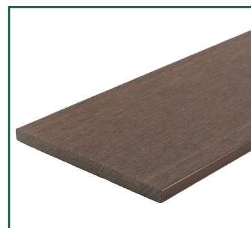
Tabla compuesta de 95% de materiales reciclados de polietileno de alta densidad y fibras de madera.